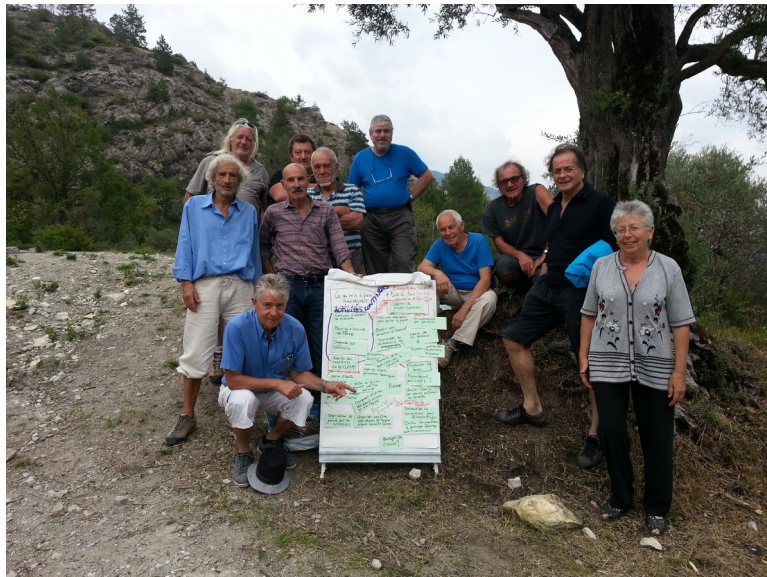
Les bénévoles devant le fruits de nos réflexions

Le Syndicat agricole de la haute vallée du Var a réuni les bénévoles de son projet de restauration d'oliveraies mercredi 14 septembre.